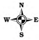
Схема согласования места размещения объекта строительства АО "Самаранефтегаз": 7307П "Сбор нефти и газа со скважин №№ 414, 419 Боровского месторождения" на территории муниципального района Сергиевский Самарской области, в границах сельского поселения Сергиевск